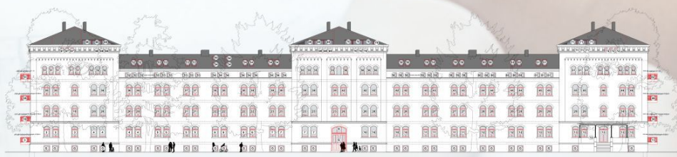
AUGUST-BEBEL-STRASSE 34 - ANNICHT STRASSE

DENKMAL Zu einem Wohnerlebnis der besonderen Art wird das ehemalige Mannschaftshaus I der „Roten Kaserne“. Alle Einheiten im Denkmal werden als Komfortwohnungen ausgebaut, mit ausladenden Wohnzimmern, die lichtdurchflutet sind, werden sie zu wahren Schmuckstücken.