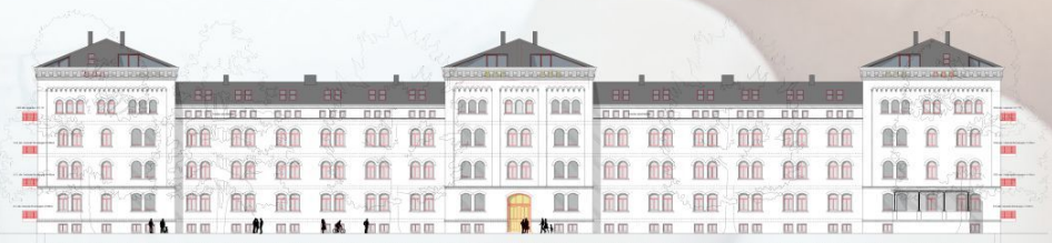
AUGUST-BEBEL-STRASSE 34 - ANNICHT STRASSE

DENKMAL Zu einem Wohnerlebnis der besonderen Art wird das ehemalige Mannschaftshaus I der „Roten Kaserne“. Alle Einheiten im Denkmal werden als Komfortwohnungen ausgebaut, mit ausladenden Wohnzimmern, die lichtdurchflutet sind, werden sie zu wahren Schmuckstücken.